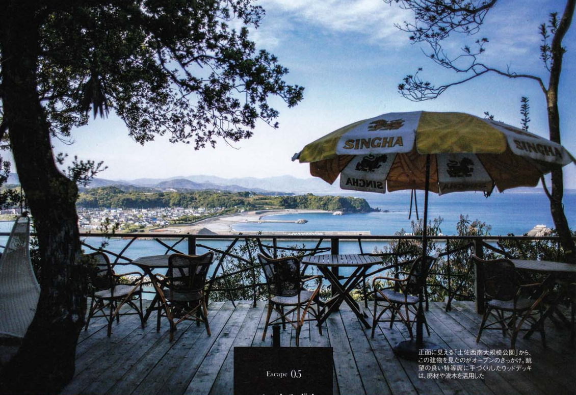
Escape 05 cafe 山みず木 高知県 四万十市

正面に見える「土佐西南大規模公園」から、この建物を見たのがオープンのかげ。眺望の良い特等席に手づくりしたウッドデッキは、廃材や流木を活用した