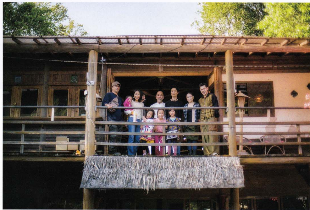
東京の一流店のコックさんやマクロビの専門家など、オーナー夫妻の人脈が集まったスタッフ「山みず木ファミリー」