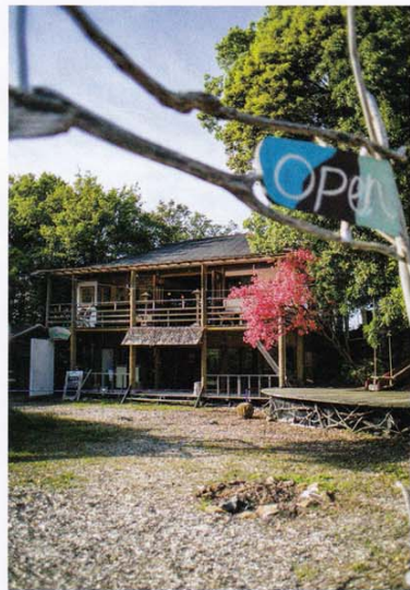
席地のような建物に手を加えて、心地良い空間に。「山みず木自然学校」など体験型ワークショップも企画されている